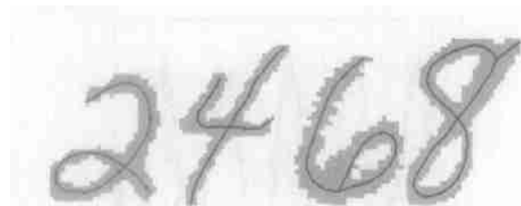
Fig. 2 Digit skeleton graphs after the behavior of the generalized PL principal curve algorithm.